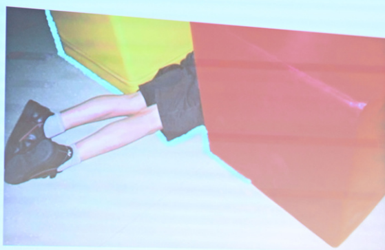
BOOS, een film van Frederike Migom